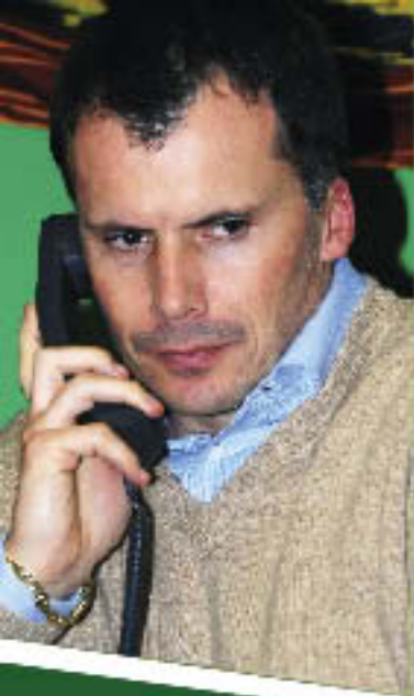
Gerry Boratto Urbanistica e Sicurezza