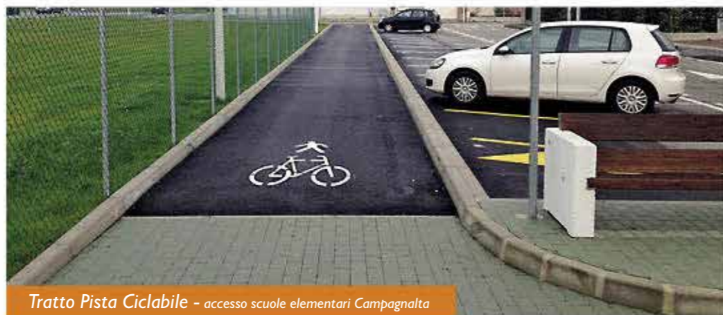
Tratto Pista Ciclabile - accesso scuole elementari Campagnalta