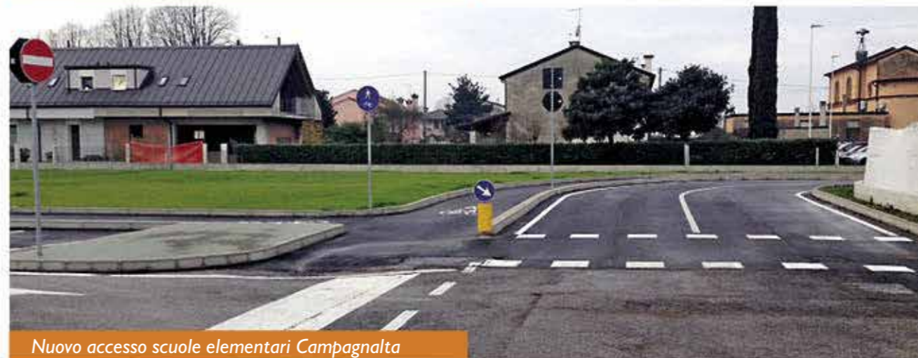
Nuovo accesso scuole elementari Campagnalta