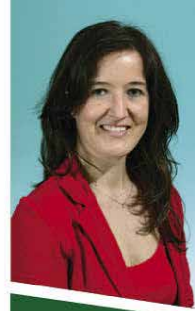
Sonia Lago Assessorato Sociale e Politiche Familiari