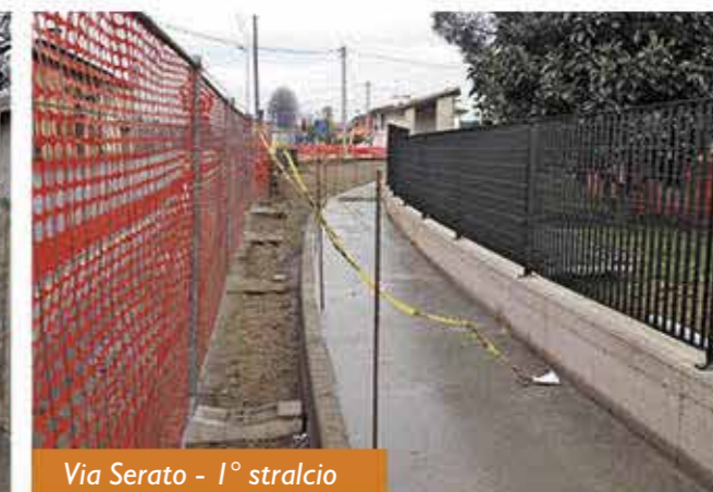
Via Serato - 1° stralcio