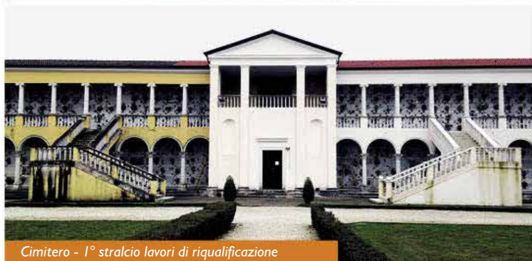
Cimitero - 1° stralcio lavori di riqualificazione