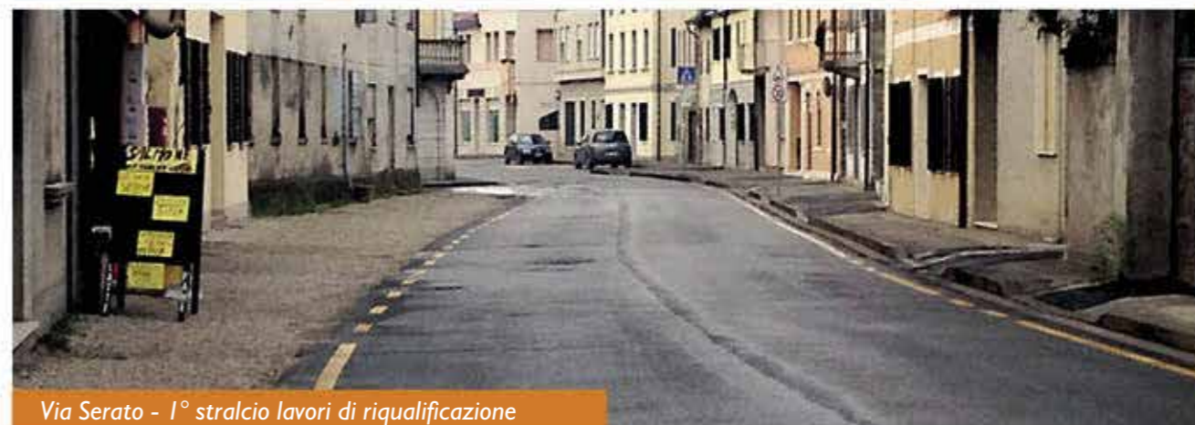
Via Serato - 1° stralcio lavori di riqualificazione