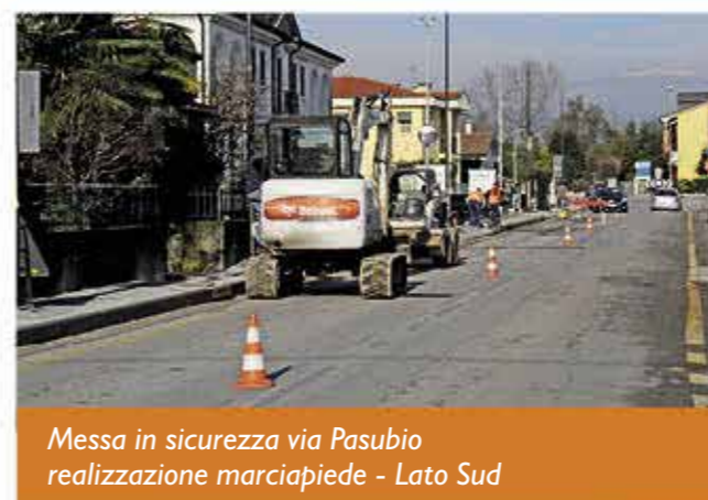
Messa in sicurezza via Pasubio realizzazione marciapiede - Lato Sud