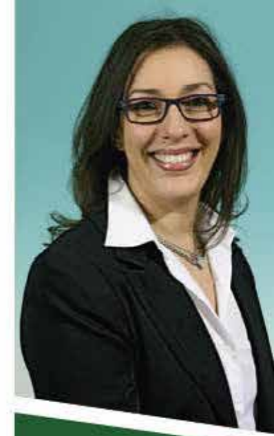
Silvia Cecchin Assessorato Pubblica Istruzione e Identità Veneta