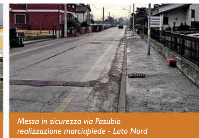
Messa in sicurezza via Pasubio realizzazione marciapiede - Lato Nord