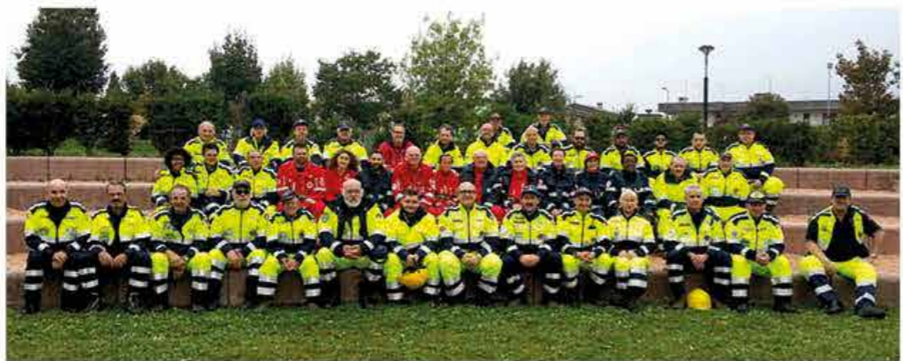
Gruppo di Protezione Civile San Martino di Lupari

Nel 2015 il Gruppo di Protezione Civile di San Martino di Lupari ha raggiunto un importante traguardo: il decimo anniversario della fondazione del gruppo stesso. Si era deciso di celebrare questa ricorrenza il 3 ottobre organizzando un'esercitazione che avrebbe dovuto vedere la partecipazione di diverse classi dell'Istituto Comprensivo. Purtroppo il maltempo ha in parte rovinato i piani costringendo i nostri ragazzi a rinunciare ad assistere alla dimostrazione alla quale erano intervenuti, a supporto del gruppo, la Croce Rossa, il gruppo Cinofili, il gruppo di Salvamento Fluviale e gruppi di Protezione Civile del distretto Alta-Padovana. La giornata è stata comunque positiva perché ci ha permesso di testare la nostra preparazione e se ci sarà occasione la riproporremo l'anno venturo. Un'altra circostanza di verifica sul campo è stata l'esercitazione distrettuale organizzata a Grantorto. Come sempre è doveroso ringraziare tutti i volontari che si mettono a disposizione in caso di calamità. Quest'anno siamo intervenuti all'inizio di settembre quando forti temporali e violente raffiche di vento hanno abbattuto numerosi alberi nel nostro territorio comunale. Sono avvenimenti faticosi, ma ciò che realmente ci ricompensa è la sincera gratitudine di chi sta vivendo un momento critico. Colgo l'occasione per ricordare, a quanti lo desiderassero, che le iscrizioni al nostro gruppo sono sempre aperte. Auguro a tutti Buon Natale e un sereno 2016.