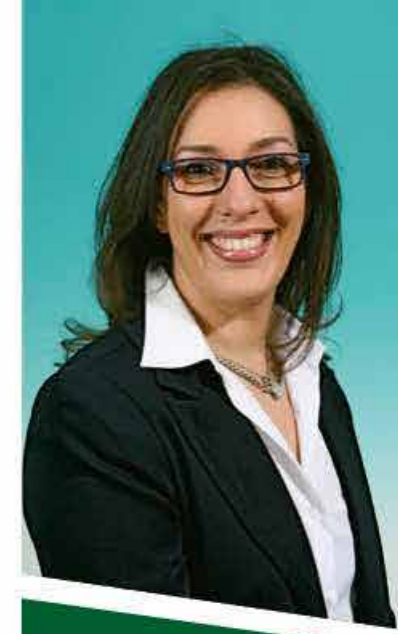
Silvia Cecchin Assessorato Pubblica Istruzione e Identità Veneta