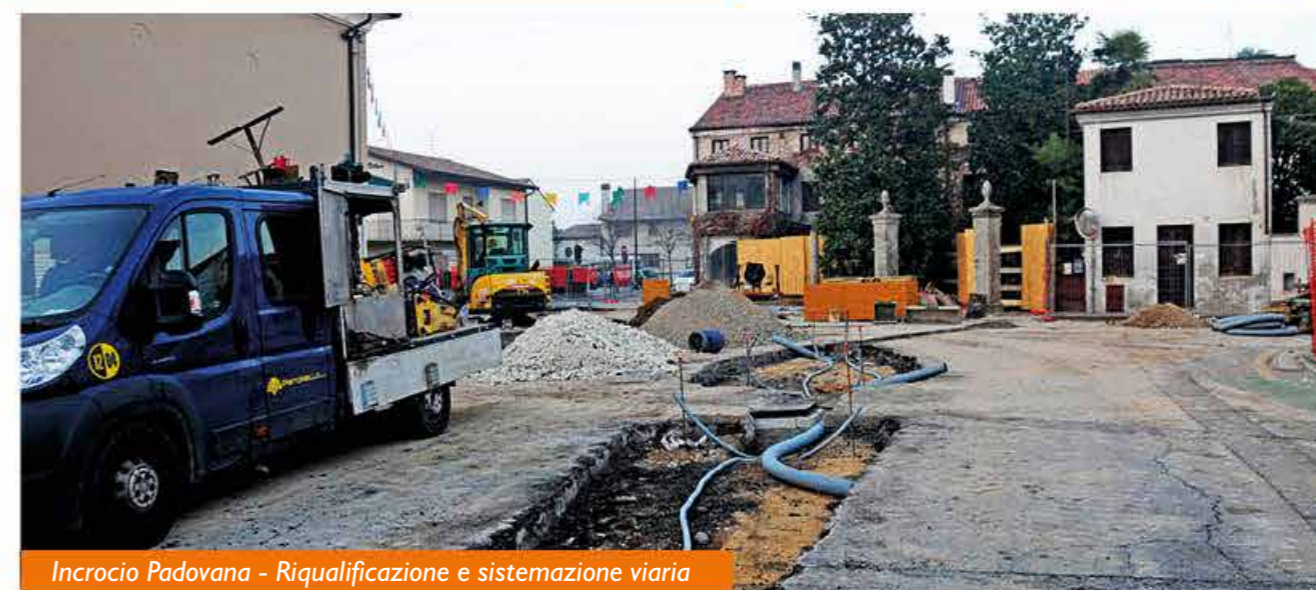
Incrocio Padovana - Riqualificazione e sistemazione viaria