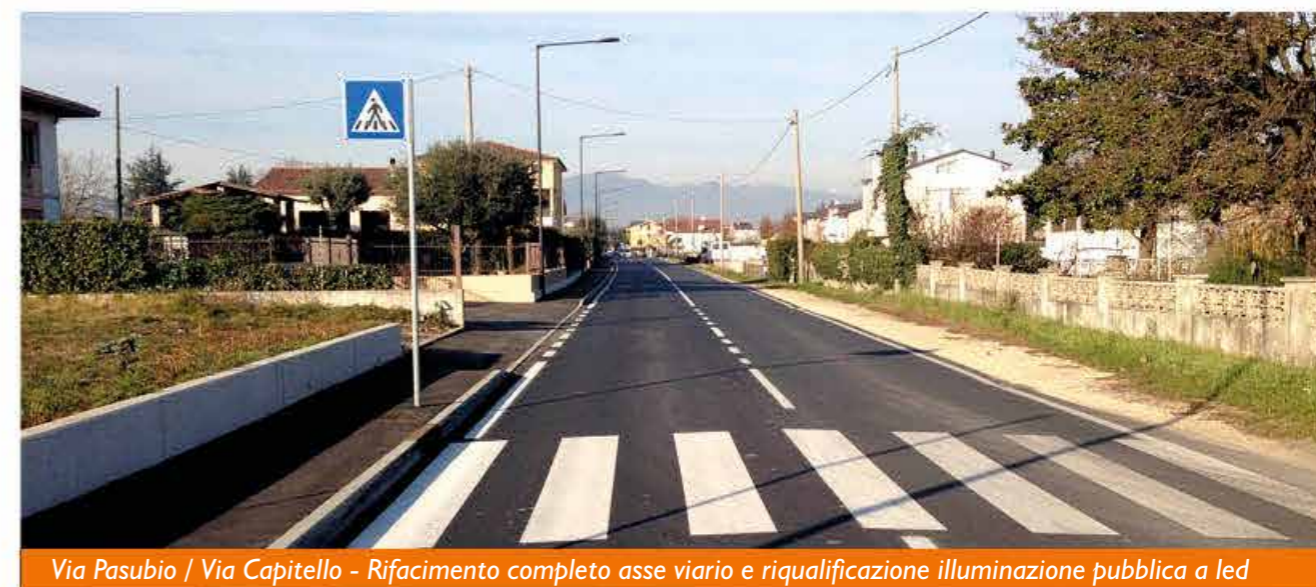
Via Pasubio / Via Capitello - Rifacimento completo asse viario e riqualificazione illuminazione pubblica a led