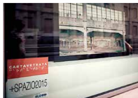
Associazione culturale Cartavetrata