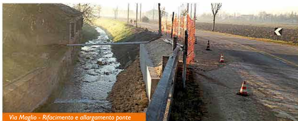
Via Maglio - Rifacimento e allargamento ponte