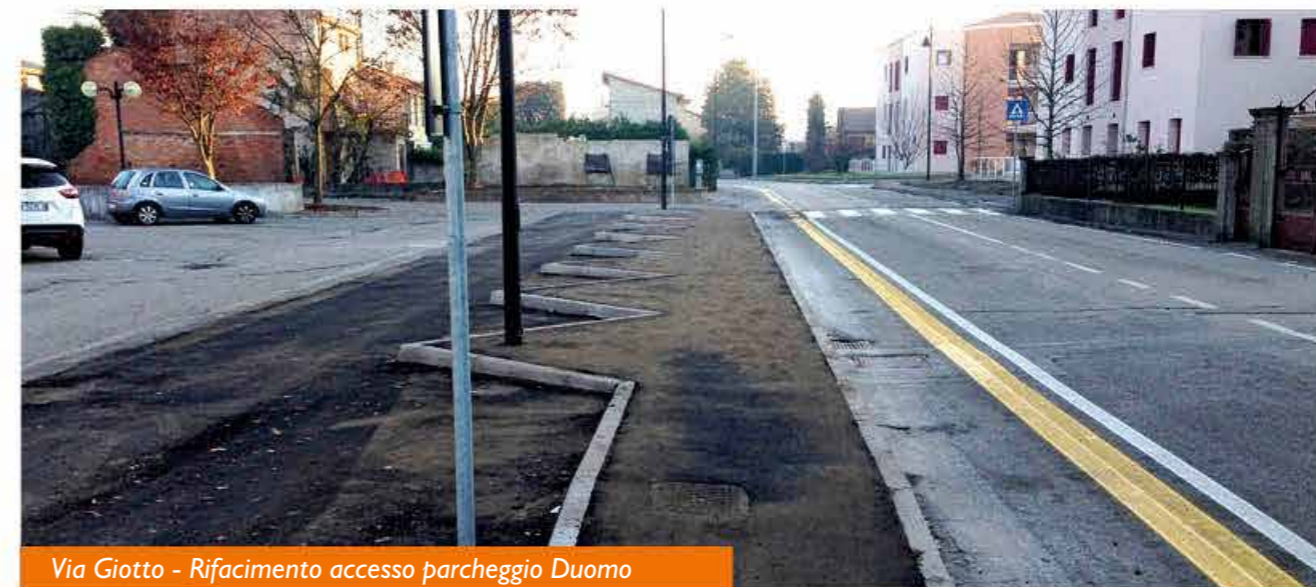
Via Giotto - Rifacimento accesso parcheggio Duomo