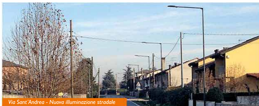
Via Sant'Andrea - Nuova illuminazione stradale

In definitiva anche per il prossimo anno continueremo a migliorare il nostro paese integrando nuovi servizi e realizzando importanti investimenti tecnologici ed energetici.