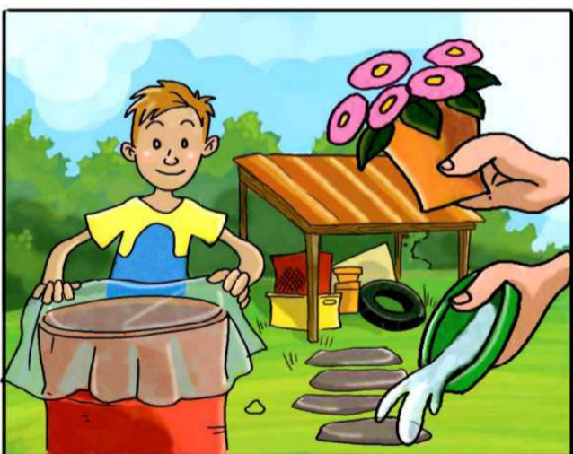
METTI AL RIPARO DALLA PIOGGIA TUTTO CIÒ CHE PUÒ RACCOLGERE ACQUA.

(*) Leggi attentamente le istruzioni riportate sulle confezioni.